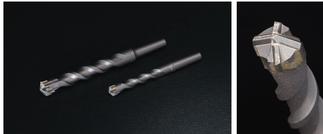
テーパークロスドリル(レギュラータイプ)