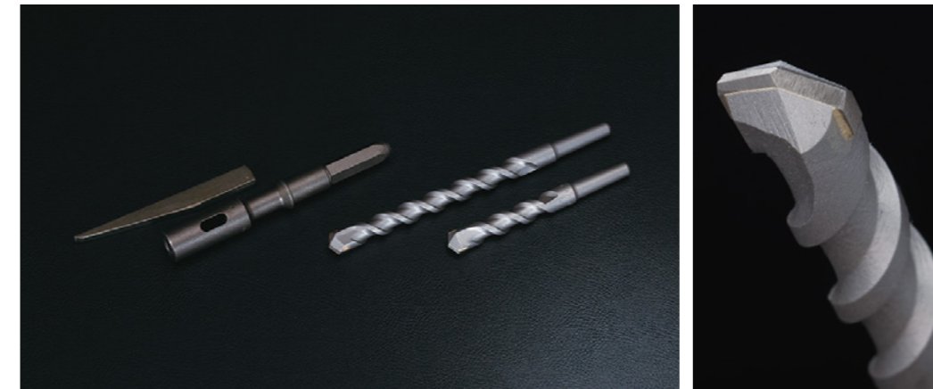
テーパースingletonドリル(レギュラータイプ)