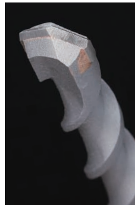
B・Hシングルドリル SDS-プラス (超ロングタイプ)